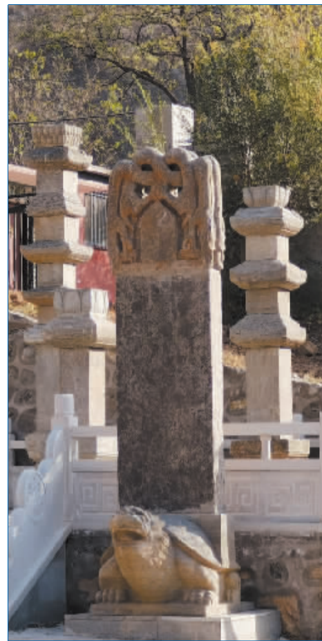
■安放在白果寺一隅的古代石碑。