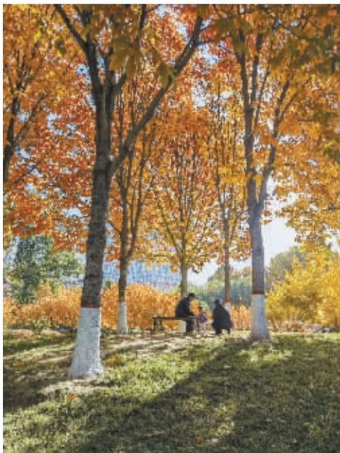
■成长的陪伴。