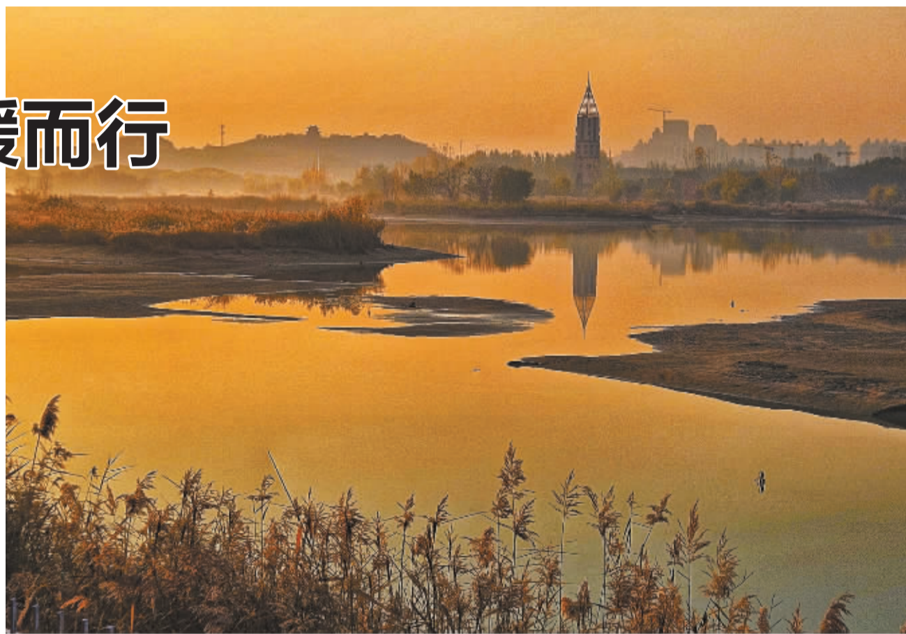
■滹沱河朝阳。

阳光透过黄绿相间的树叶,柔和地洒落在身上,令人心生温暖,连初冬的冷峻都冲淡了不少。浅冬安暖,那种冰冰凉凉,清清淡淡的舒爽感觉,似乎只有在这个时节才能感触到。推着轮椅上的年迈父母一起出行,那是岁月年轮的延伸;斑驳的树林间祖孙欢乐嬉戏,那是亲情在隔代间的延续;候鸟在铺满残荷的水面上追逐,那是万物生灵的欢舞……大自然的每一个角落都是亦真亦幻的诗,在洒满阳光的大地上,让我们踏着浅冬,一路温暖同行。