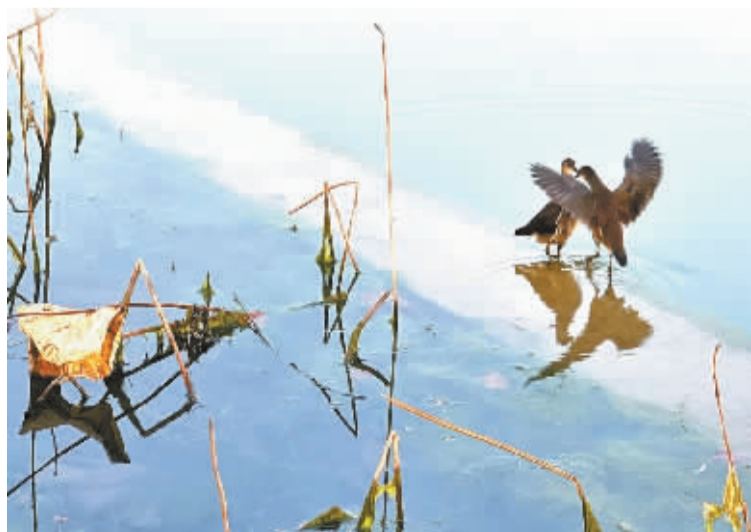
■欢舞的精灵。