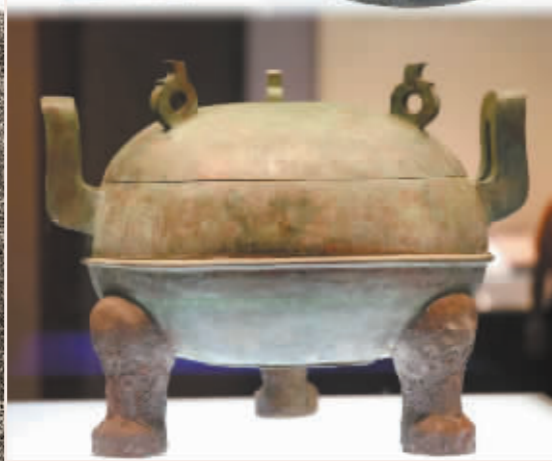
河北博物院陈列的“中山三器”。