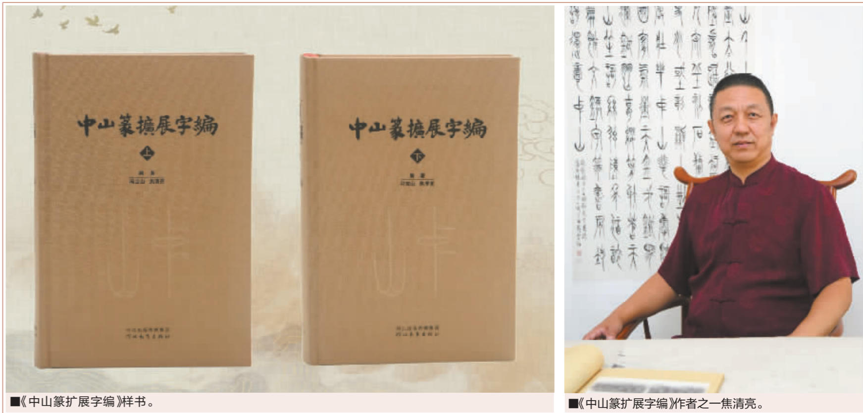
《中山篆扩展字编》样书。