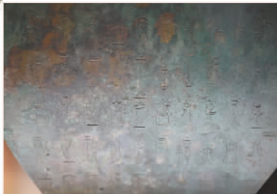
“中山三器”器身的铭文十分精美。