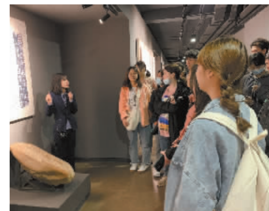
越来越多的年轻人了解并传承着中山国文化。

品创作方面,今年就有以中国医学史上“金元四大家”之一的李杲(生于真定,今石家庄正定)为原型的新编历史剧《东垣大医》,成功首演,颇受各界好评,并入选了第十八届中国戏剧节。 而让更多人感受最直接的,就是对历史遗址的保护以及场景的再现。比如东垣古城遗址公园等景点的陆续修缮开放提升,“让人们在流连忘返中,留住了文化记忆。” 位于西二环与和平路西北角的中山国文化特色园林,就是其中代表。而今走进这座占地近 13 亩的园林广场,辅首、山字形器、双翼神兽等中山国代表元素在其中巧妙植入,在水车马路的路边,正待更多人来此怀古驻赏。 “活水源流随处满,东风花柳逐时新”。让更多古文字和文物、文化遗产活起来,需提升其活化利用水平。《中山篆扩展字编》的集结出版,以创新传承让古老文字焕发生机,这是传承,更是创新。如何利用文化资源、地理优势、决策优势,打造可持续经营的文化产业项目,做成文化旅游融合的文化大品牌,如何通过文化产业开发实现对历史文脉的又一种“唤醒”,让厚重的历史沉淀在新时代的创新发掘中被激发出来,这条路正越走越宽!