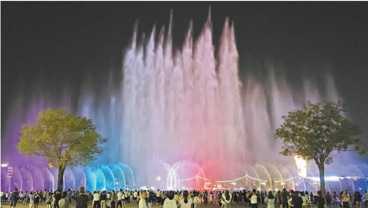
■滹沱河畔美丽的灯光水秀。

滹沱河畔的光影水秀,那是色彩与灯光赋予水的音节;道路延伸、桥梁起架,那是劳动者的汗水凝固在钢筋水泥上的音节;水草相连,绿意茵茵,那是生态环境与城市完美融合的音节……无论是高楼林立的城市中心,还是纵横交错的街角巷尾;无论是熙熙攘攘的公园广场,还是宁静恬淡的城市近郊,我们总能感受到这座城市的韵律。工地上震耳的响声、菜市场叫卖的声音、林荫间鸟儿的鸣唱,都是城市活力的展现,热情的迸发,它们不断汇集,从音节到旋律,交汇成一首生活的美好乐章。