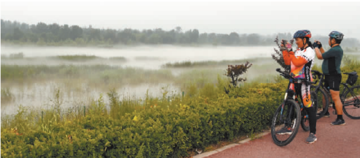
■白雾缥缈水草间。