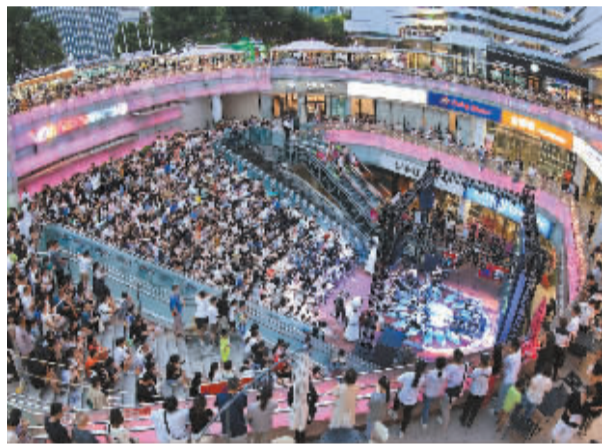
■省城某商城的演出,吸引了众多市民。