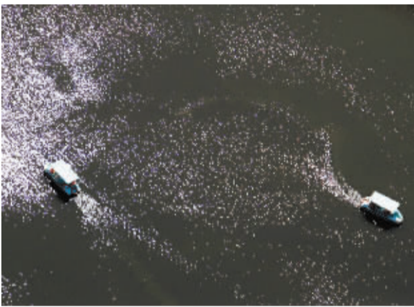
■俯瞰世纪公园湖面,小舟横渡,波光粼粼。