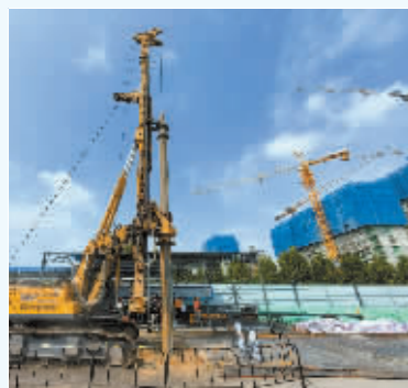
■地铁 6 号线一期工程打下第一桩。

刚刚过去的 8 月份，石家庄各项事业发展取得了一定成效，让广大群众对石家庄的信心日益增强，让社会各界对石家庄的预期持续向好，也让我们加快发展的底气更足。未来，全市上下必定进一步坚定信心、鼓舞斗志，大干三季度、决胜下半年，确保圆满完成全年目标任务。