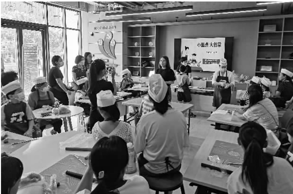
■尚水苑社区组织的亲子活动挺受欢迎。