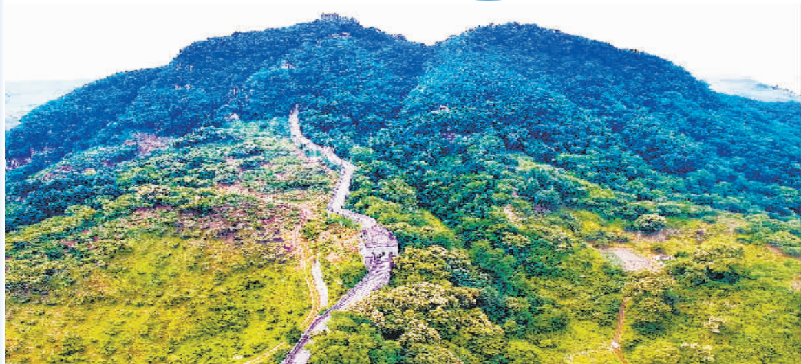
■丹东虎山长城景区。