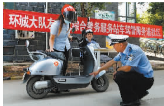
■民警向居民讲解雨天骑行时的注意事项。

本报讯(首席记者 刘琛敏)汛期,安全出行尤为重要。为降事故、保安全,让广大居民提高安全出行意识,8月3日上午,石家庄市公安局交通管理局环城交警大队友谊北警务站车驾管普法小分队,走进新华区赵陵铺路街道后太保社区,针对居民们的汛期安全出行,进行了细致有效的宣传及讲解。