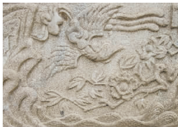
■行唐琉璃庙东山墙下的汉白玉浮雕(局部)。