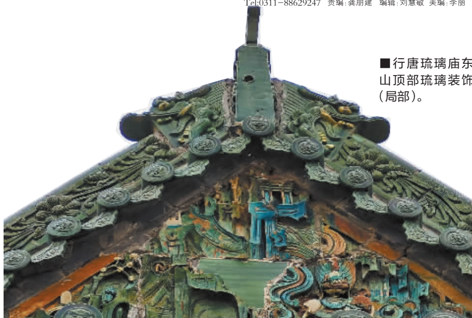
■行唐琉璃庙东山顶部琉璃装饰(局部)。

“大都好物不坚牢，彩云易散琉璃脆”——唐代诗人白居易的诗句道出了琉璃的精美与保存不易。繁复精美的琉璃构件，仿佛流霞霓彩，将古代建筑装饰得富丽堂皇、庄严大气。不过，由于烧造成本高昂，琉璃在古建中一般只用于顶部装饰。但是，石家庄市行唐县独羊岗乡东差取村，却有一座外部装修基本采用琉璃构件的明代琉璃庙。这座历经 400 余年风霜的古建筑，虽多有残损却依旧色彩斑斓，堪称千年古县一道独特的风景。