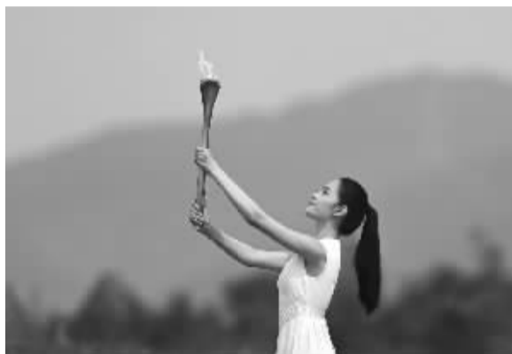
■采火使者点燃采火棒。

动员大会召开,主会场设置在杭州黄龙体育中心,通过视频连线的方式,串联起设置在各协办城市和各竞赛场馆的分会场,各场馆运行团队全体工作人员参会。