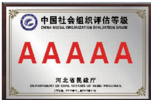
■中国社会组织评价等级