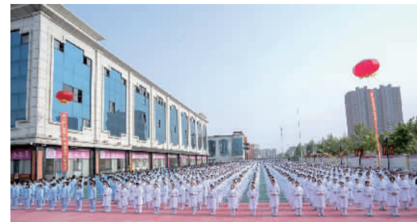
■学生参加集体活动