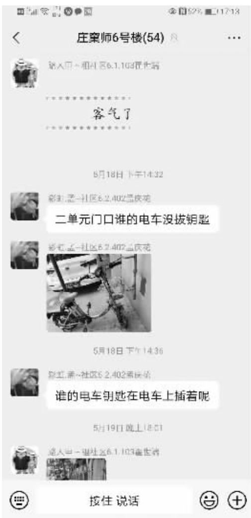
■业主群里邻里守望相助的画面很温馨。

除了业主间偶有“小摩擦”,还有的业主经常在群里对物业“开炮”:物业管理,不要只在群里喊口号,要责任到人,想出解决问题的办法。