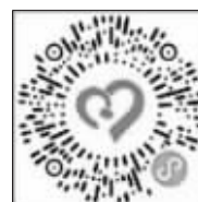
■河北爱心助困送温暖