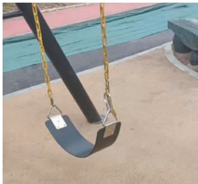
■3月24日一大早,明珠公园工作人员更换了秋千配件。

3月24日下午,记者再次来到拾光智慧体育公园,先前出现破损的蹦床依然如故,仍不时有孩子们在蹦床未破损的一侧蹦跳玩耍。“尽快进行维修吧,消除眼前的安全隐患。”一位宝妈对记者说。关于此事,本报记者将持续关注。