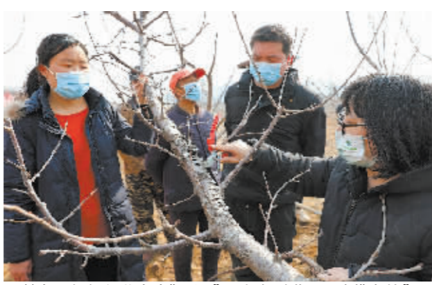
■赞皇县组织行业专家“下沉”,现场把脉指导果树“春剪”。