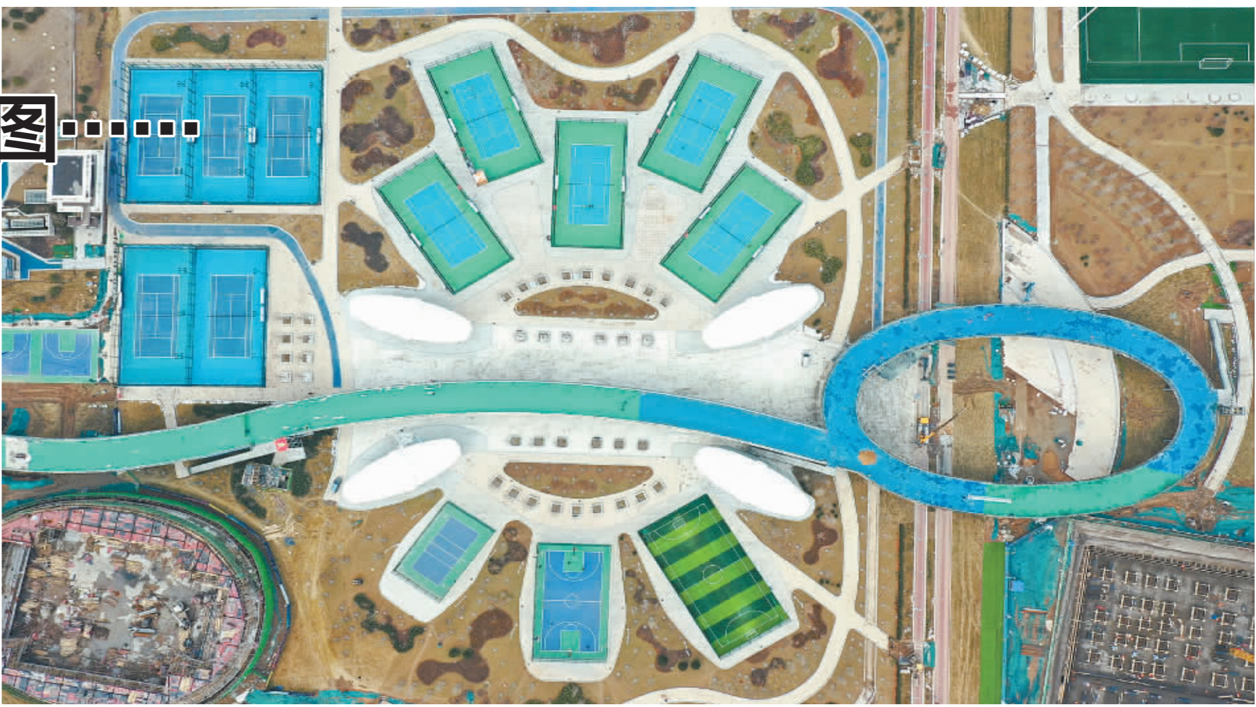
■高铁片区中央绿色体育公园的 6 个足球场、如意彩虹空中走廊等已向市民开放。