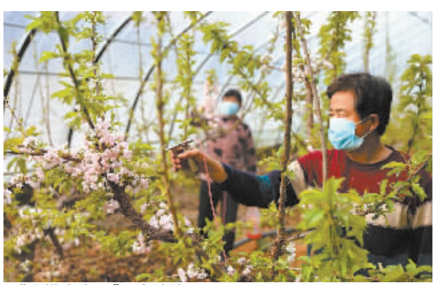
■“人勤春来早”画卷徐徐展开。