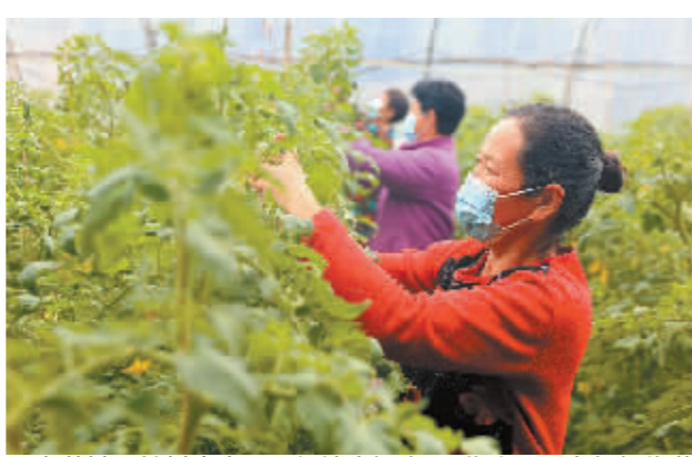
■在藁城区社村生态园西红柿大棚内,工作人员正在打杈绕蔓。