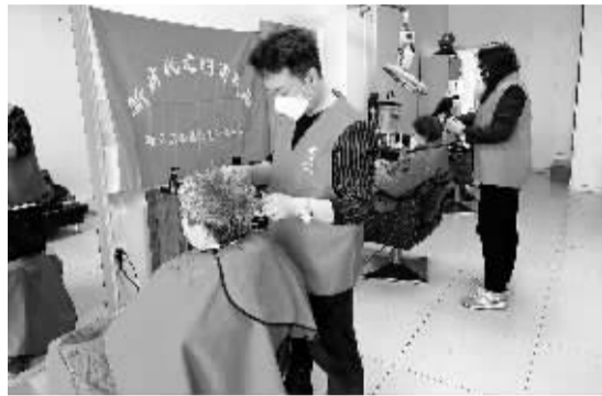
■义务理发暖民心。

新华区石岗街道柏林一社区党委联合花都形象艺术设计学校的学生,为辖区行动不便的老人义务理发,打通了服务居民的“最后一公里”。新华区西苑街道西苑社区开展的“二月二、龙抬头,志愿服务暖心头”系列活动多姿多彩。当天一大早,西苑社区居民早早来到活动地点讨个好彩头,来自辖区美格理发店的志愿者热情的服务和精湛的手艺赢得居民们连连称赞。在西苑社区活动室,来自西苑少儿活动中心的老师们正为孩子们讲解“二月二”的来历和意义,并手把手教孩子们趣味剪纸。一张红纸经过寥寥数剪,就变成了一个精美的图案,孩子们看得兴趣盎然,跃跃欲