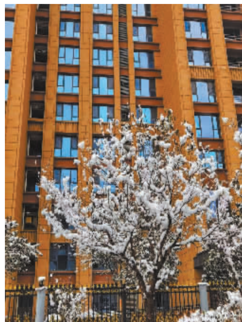
■千树万树梨花开。