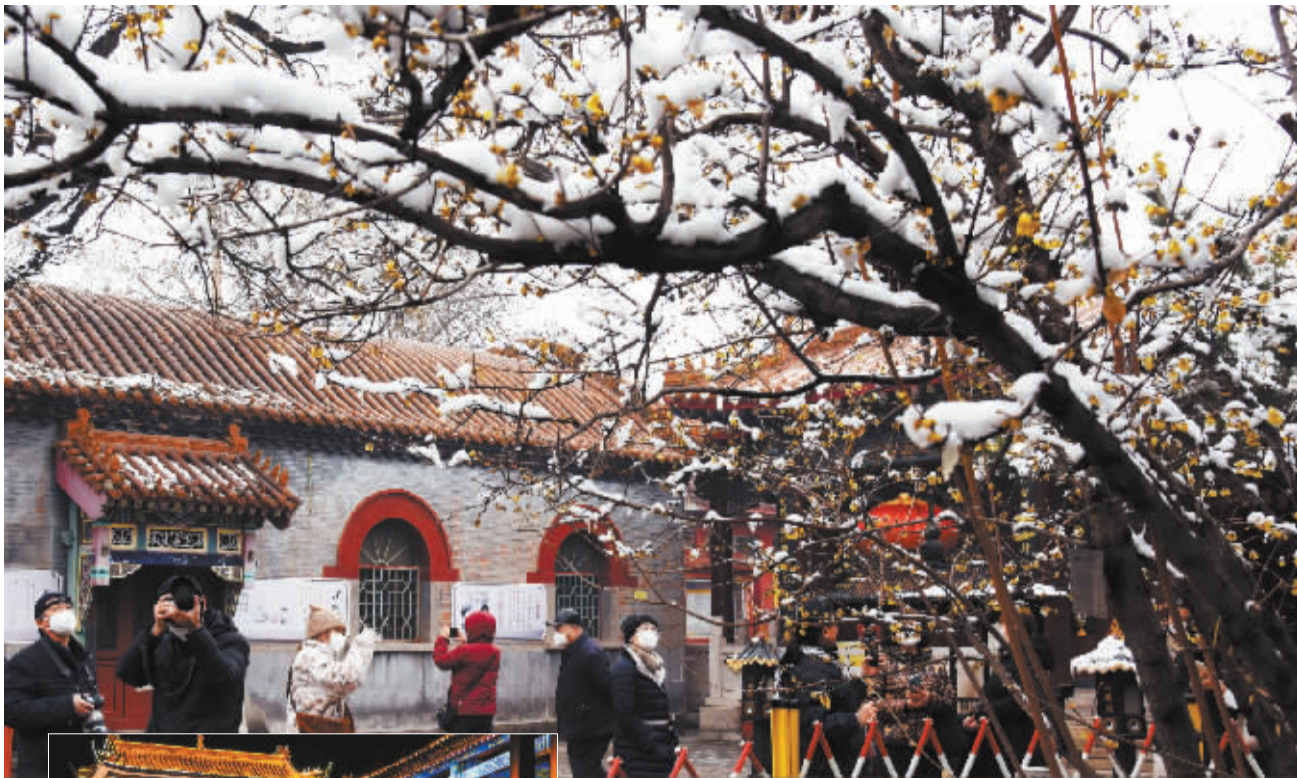
■十方院里腊梅香。