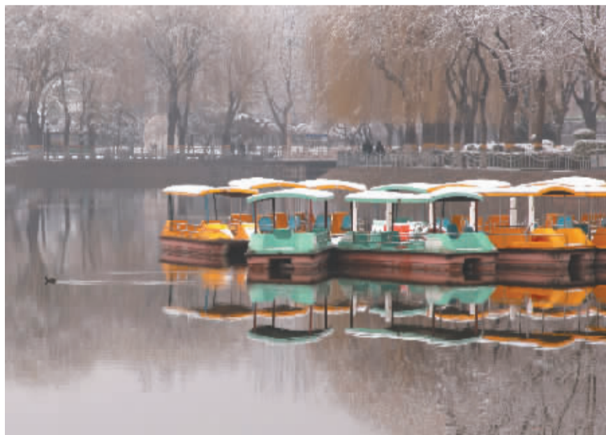
■雪拂嫩柳压彩舟。

残雪暗随冰笋滴，新春偷向柳梢归，立，是“开始”之意；春，代表着温暖、生长。立春时节，春雪压枝头，却压不住腊梅的花香，更掩不住柳条微微泛起的嫩黄。春天回归，万木繁荣，那是大自然给土地最美的礼物，一年之始，一春之初，大家驿动的心，则是人们对一年丰收的愿景和希望。