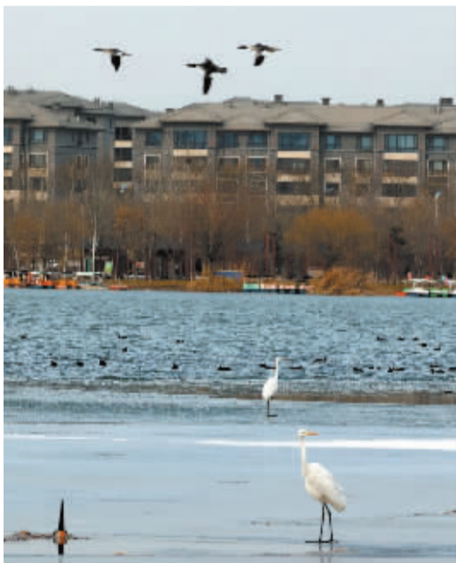
■滹沱河畔家园美。