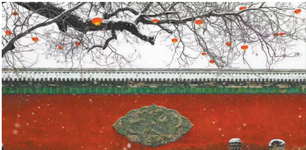
■红墙雪灯兆丰年。