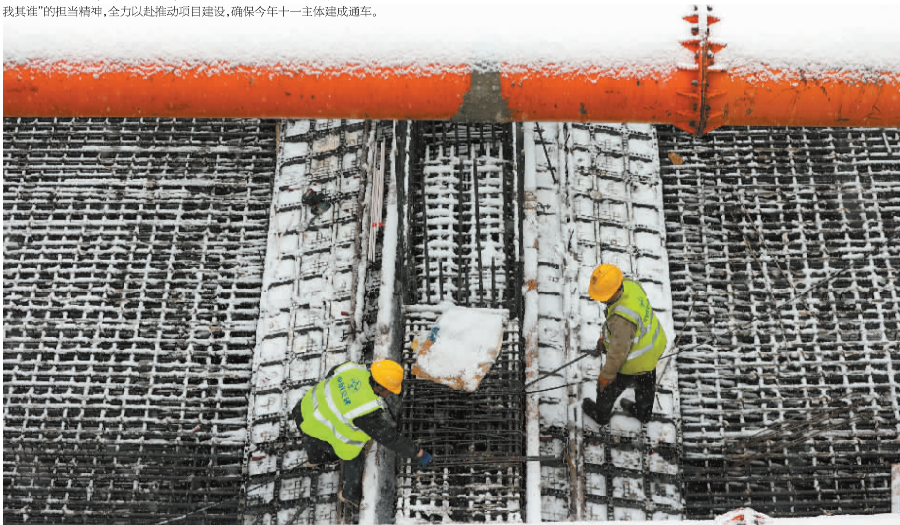
■学苑路隧道段施工现场,施工人员进行模板加固。