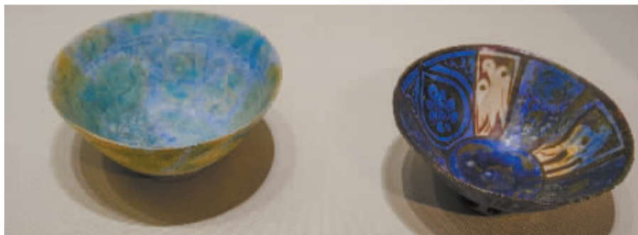
蓝绿色釉陶碗。