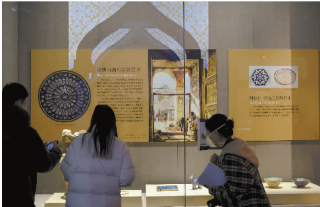
参观者在展品前流连忘返。本报记者 王建国 摄

今日，玫瑰国度——叙利亚古代文物精品展”将亮相河北博物院，198件/组叙利亚文物齐齐登场，描绘了长达50万年的文化图景和波澜壮阔的历史画卷。