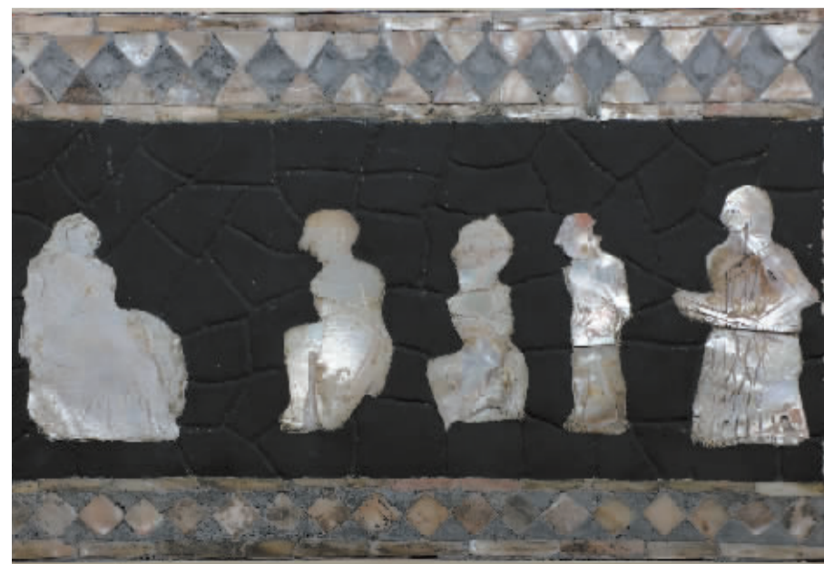
珍珠母贝镶嵌画。