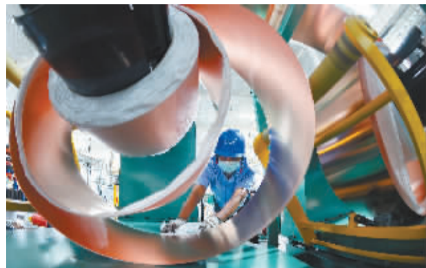
■石家庄科林电气设备有限公司生产线。