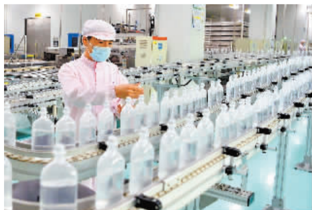
■石家庄四药生产线。