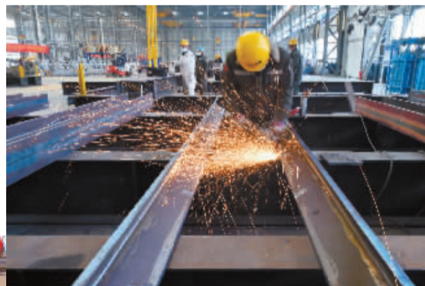
■高新区金环建设钢结构生产车间,工人进行产品加工作业。