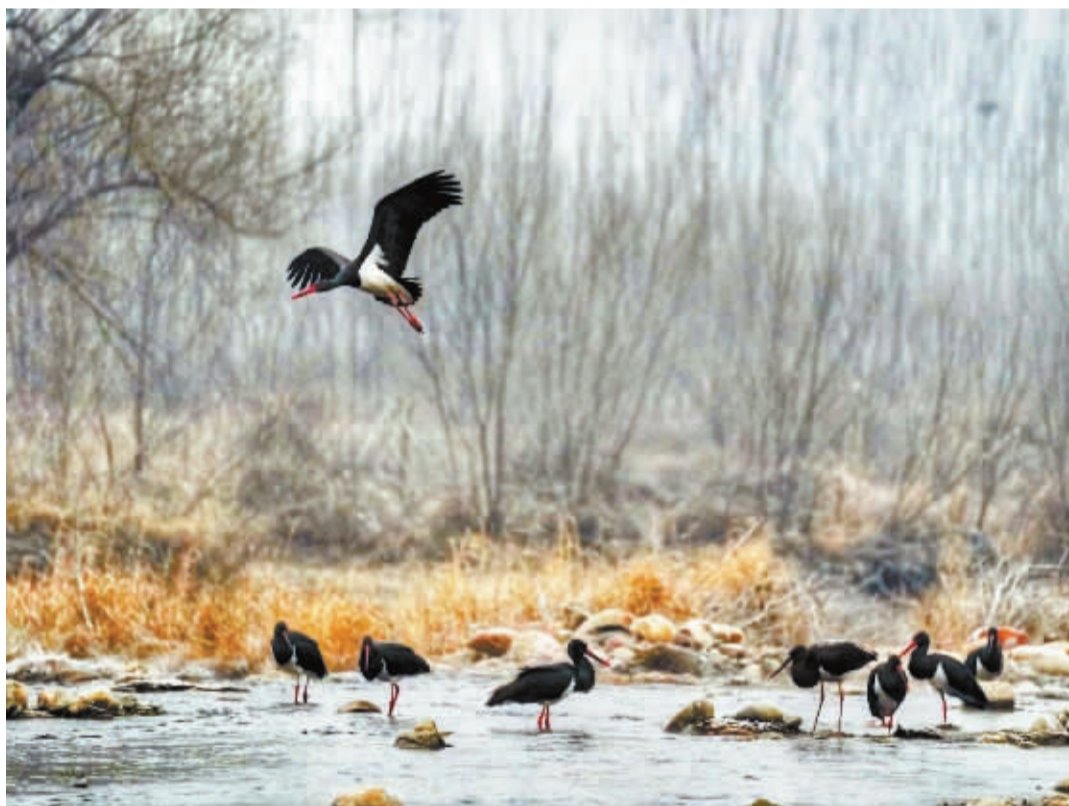
■精灵的家园。