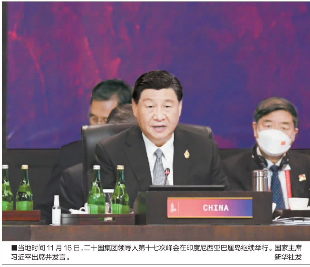
■当地时间11月16日,二十国集团领导人第十七次峰会在印度尼西亚巴厘岛继续举行。国家主席习近平出席并发言。

一要坚持多边主义,加强国际合作。合力营造开放、包容、公平、公正、非歧视的数字经济环境,在数字产业化、产业数字化方面推进国际合作,释放数字经济推动全球增长的潜力。搞所谓“小院高墙”、限制或阻碍科技合作,损人不利己,不符合国际社会共同利益。二要坚持发展