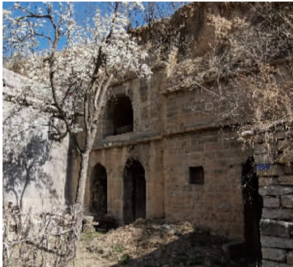
■七狮村古老的土窑洞。

前文说到,明代时村民们陆续搬迁到甘陶河西岸,临河背坡挖土窑居住,由此形成一种富有特色的民居——以土窑作上房,两侧再建筑石窑(石券窑)为配房。至今,村内仍保存有明、清时期特色土窑 186 眼、石券窑 80 眼、石楼院 18 座、石头四合院 16 处。毕家大院就是一座典型的石头四合院,作为七狮村第