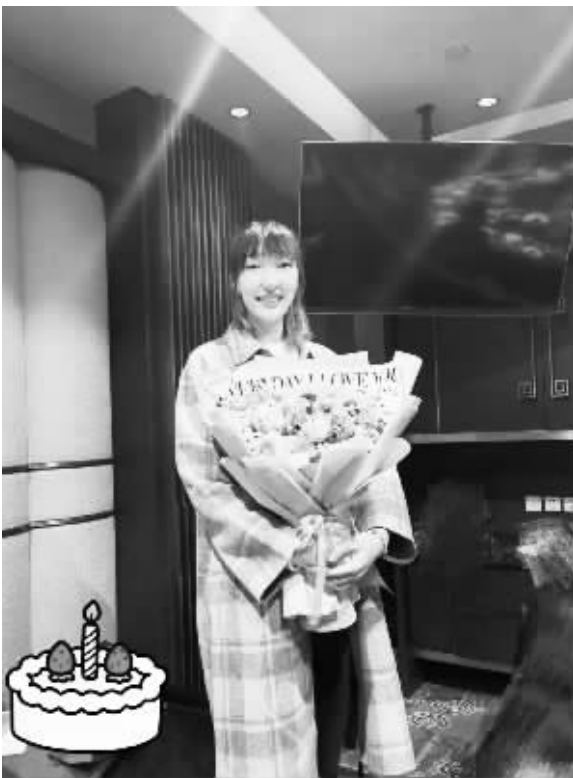
■生日那天韩旭收到一大束鲜花。