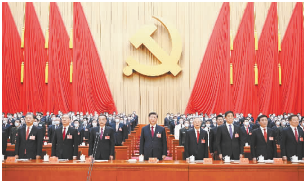
■10月16日,中国共产党第二十次全国代表大会在北京人民大会堂开幕。这是习近平、李克强、栗战书、汪洋、王沪宁、赵乐际、韩正、胡锦涛在主席台上。