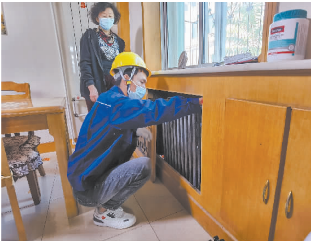
■供热企业工作人员入户检查。