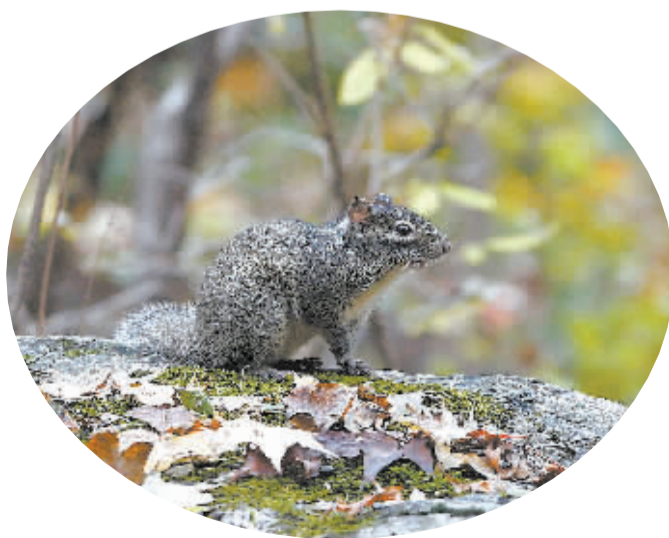
■小松鼠一直伴随着游人。

记者用无人机在空中拍摄,太行之秋美得超乎想象,漫山红叶、层林尽染、色彩斑斓。不管你是旅游达人,还是摄影爱好者,最不该错过的就是太行山的秋天,因为这时候的太行山,数不清的曼妙姿态,看不尽的画意水彩,品不完的山川,让人眼花缭乱,让游人尽享秋游乐趣。