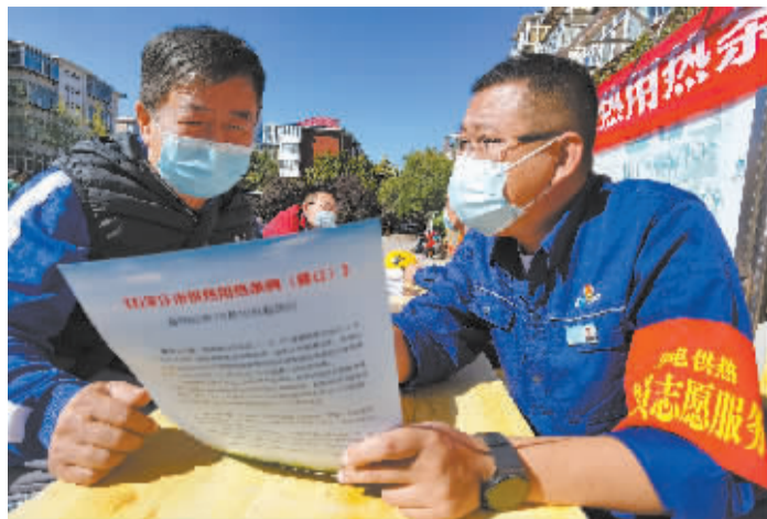
■石家庄市城管局、石家庄市供热事务中心以及供热企业走进社区,解读新条例,现场解答市民问题。