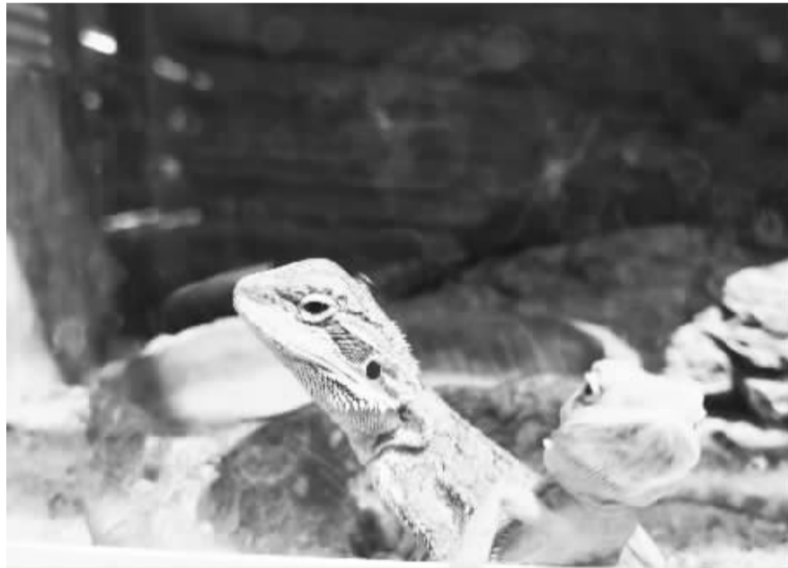
■花鸟虫鱼市场售卖的蜥蜴。