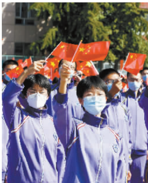
■操场周围的学生手挥国旗。