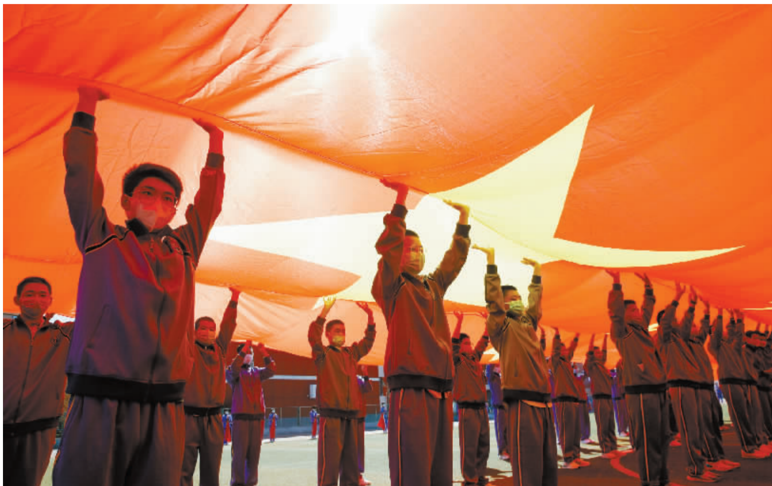
■100 名学生高高托起巨幅国旗。