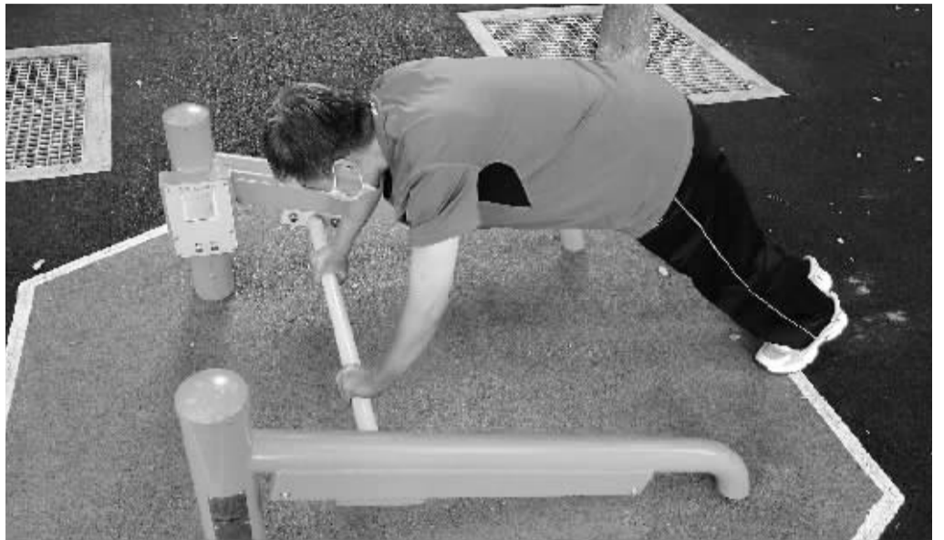
■市民在健身公园内锻炼。