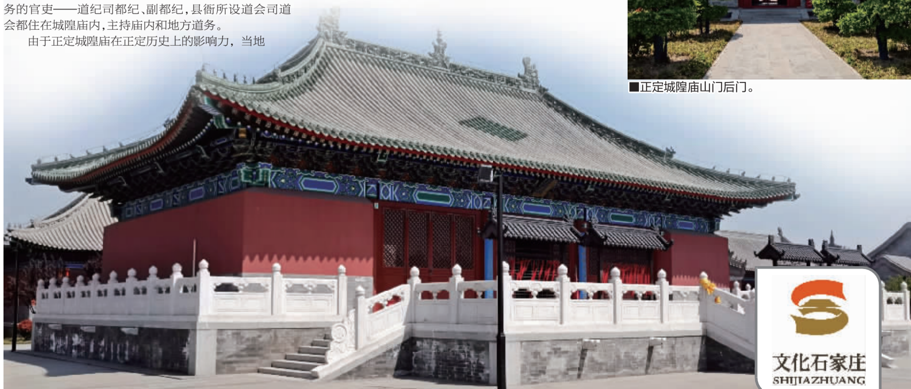
■正定城隍庙庑殿顶正殿。