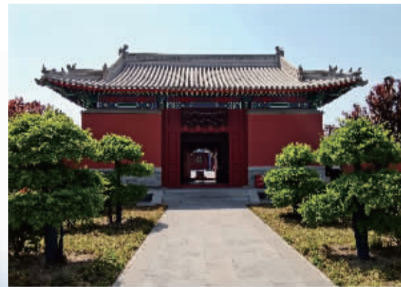
■正定城隍庙山门后门。