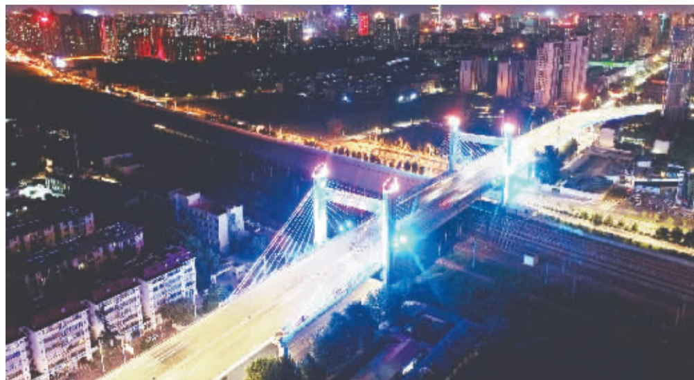
■槐安路斜拉桥在城市夜景的衬托下显得格外美丽。