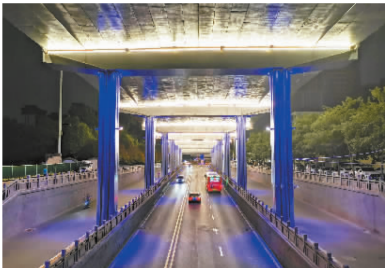
■洗墙灯将槐安路桥下照亮。

高55米,桥长235米,桥宽28.5米。要想在这座大桥上安装发光体,真的不是一件容易的事情。“亮化用到的发光体,全部都是围绕着槐安路斜拉桥量身定做的,种类有RGB+4000K洗墙灯、拉锁抱箍灯、扶手护栏灯、投光灯还有网格屏,全部使用的节能灯低耗电。目前,除了内侧斜拉钢索的拉锁抱箍灯没有安装外,其它基本安装完毕。所有的发光系统颜色、亮度、开启、关闭还有网格屏,都是通过网络来控制,一部手机就能搞定。同时,抗干扰、防水和耐久性都经过了严格测试。”项目部王经理告诉记者。灯光照明本身也是思想的体现,桥梁照明使光、景、情、融为一体,在点亮大家心境的同时,也装扮了城市的曲线之美。桥梁亮化照明设计,作为城市亮化照明工程的一部分,已经得到越来越多的市民认可,成为石家庄城市亮化的风景线。