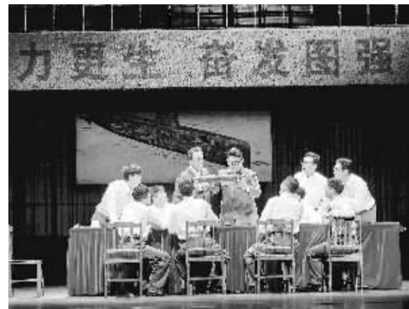
■话剧《深海》剧照。

本报讯(记者 黄莹)7月31日、8月1日,广东省话剧院精心打造的话剧《深海》在河北省艺术中心连续上演,这部融汇了“硬核科技”的诚意之作,讲述了以“核潜艇之父”黄旭华为代表的科研工作者,为实现我国国防科技发展从追赶超越,从零开始研制大国重器的故事。演出结束后观众反响热烈,市民张春浩表示:“深受教育和感动,这部主旋律的话剧真的好看。”