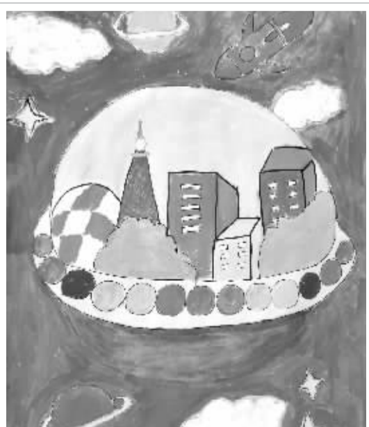
■未来星球 机场路小学三(1)班 张雅岚(小记者)绘