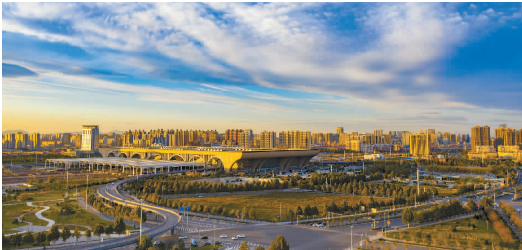
■云霞映照下的石家庄站。