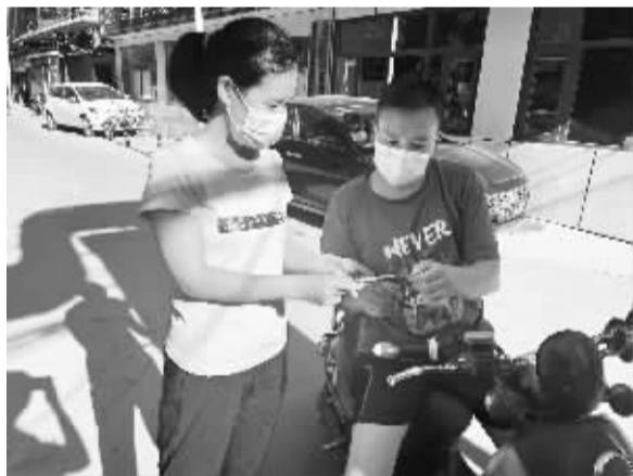
发放“连心卡”当好贴心人

7月12日,石岗街道行政综合服务中心工作人员走进社区、沿街门脸开展“政策找人 服务上门”为主题的城乡居民养老保险政策宣传活动。通过悬挂横幅,发放政策宣传单,面对面宣传等方式,就养老保险的参保覆盖对象、缴费档次、政府补贴优惠、待遇领取、所需材料等情况进行了详细解答,为居民算好“明白账”“长远账”,让他们理解缴费政策,自主选择合理缴费档次,知晓城乡居民养老保险政策惠从何来、惠在何处,有效提高了居民对政策的知晓率和满意度,为今后城乡居民养老保险工作的推进和落实奠定了良好的基础。