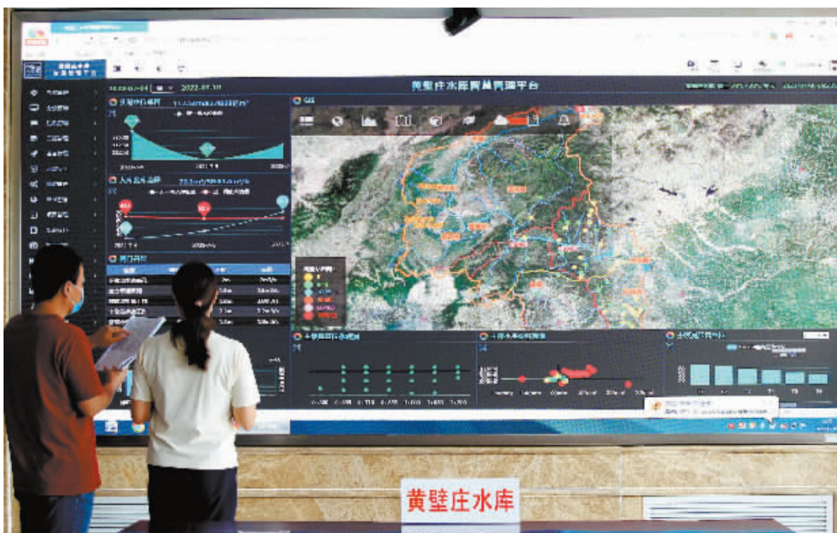
■工作人员正在通过智慧管理平台监视水库的水位、库容、水情。