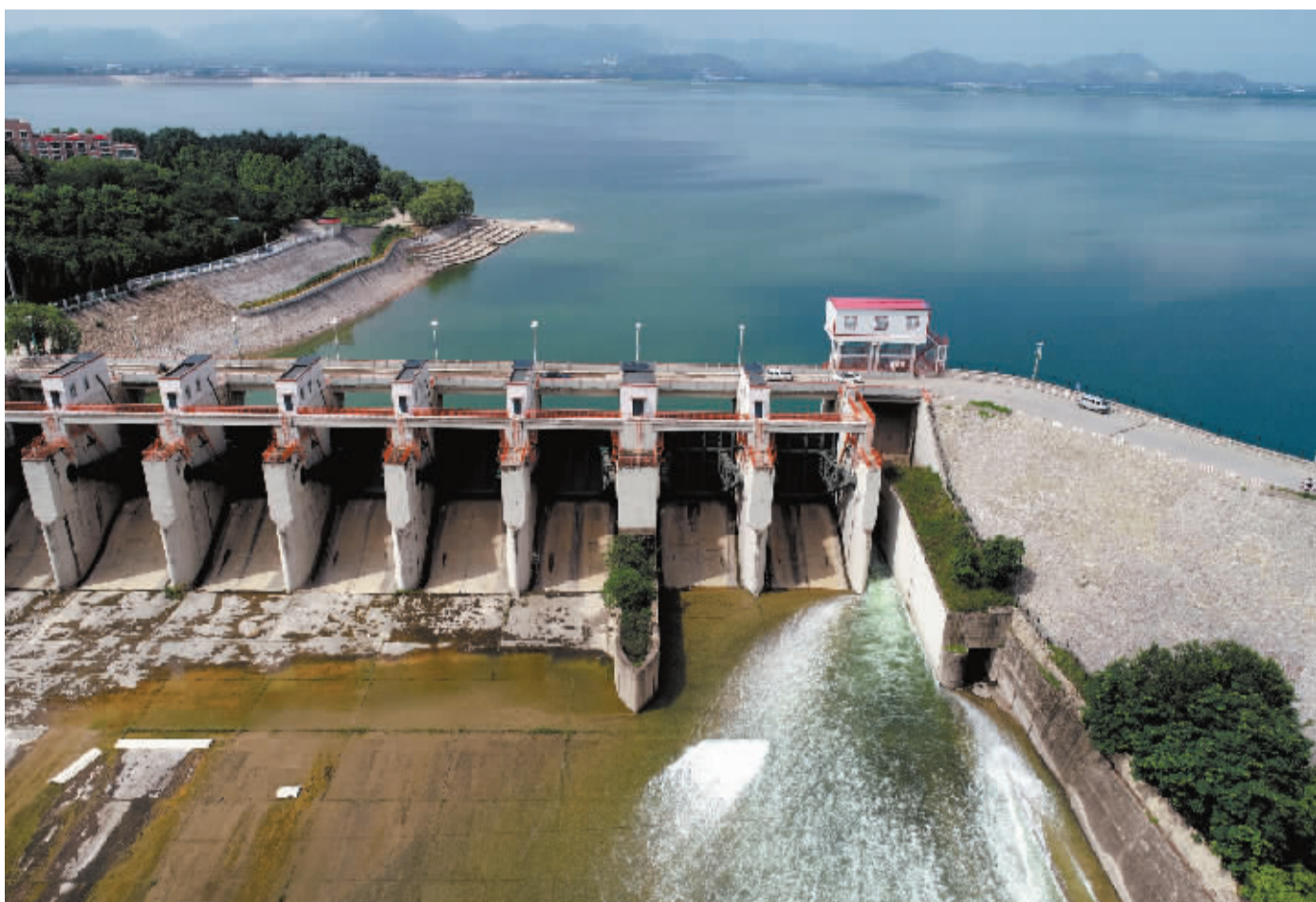
■黄壁庄水库正常溢洪道底孔正在进行预泄腾库容。