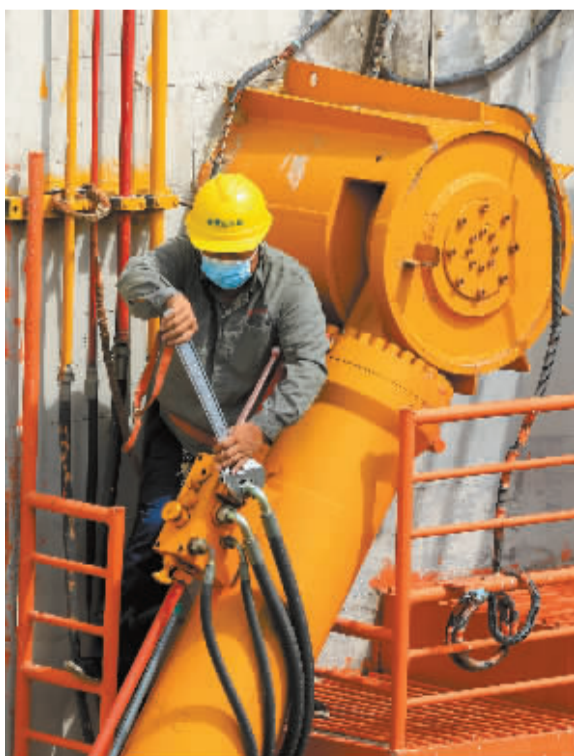
■工作人员检查每一个螺栓和液压杆转轴。

记者在黄壁庄水库事务中心应急抢险仓库看到,防汛物资摆放得井然有序,工作人员正在对冲锋舟、救生衣等防汛物资,进行系统登录。在库房外的防汛船上,配备了救生衣等各种设备,可以随时下水工作。