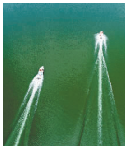
■工作人员驾驶快艇巡查水库。