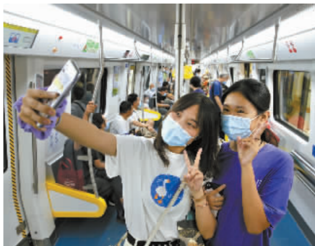
■乘客开心乘坐地铁。