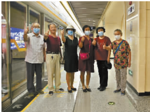
■乘客给地铁大大的赞。

风好正是扬帆时,重整行装再出发。石家庄轨道交通集团将持续深化党的建设,不断加强党建引领,充分发挥轨道交通资源优势,积极融入全市高质量发展新格局,持续提升服务水平,不断提高乘客满意度,为加快建设现代化、国际化美丽省会城市不懈奋斗,以优异成绩迎接党的二十大胜利召开。