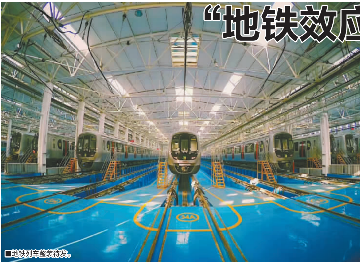
■地铁列车整装待发。