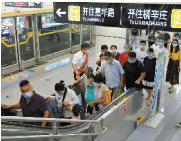
■乘坐地铁成为众多市民出行首选。

与此同时,新冠疫情发生后,石家庄地铁严格落实好常态化疫情防控各项部署要求,确保疫情防控和运营服务“两手抓、两不误”,为广市民提供了安全放心的乘车环境。