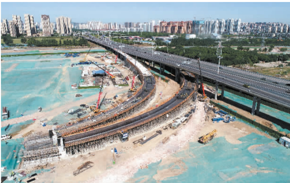
■复兴大街 C、D 匝道施工现场。