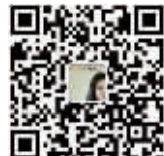
更多精彩请关注“乐尚新生活”公众号

未来智慧商业的发展,必将以精准满足消费者多元化需求为目标。实体经济将会进行更深层次的数智化技术革命。今后,太和集团将继续加强商城的数智化服务,建立服务便捷、功能强大的智慧太和消费服务平台。