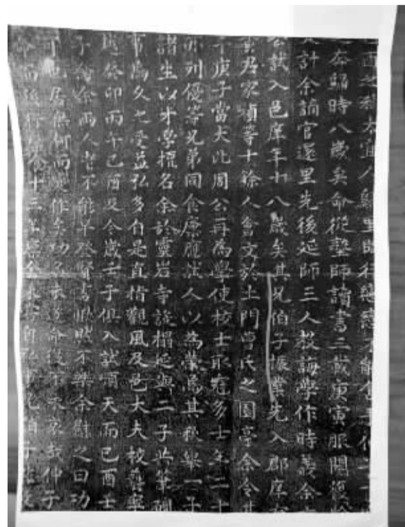
■曹家花园的碑文中发现了“其兄伯子振业”等关键词。