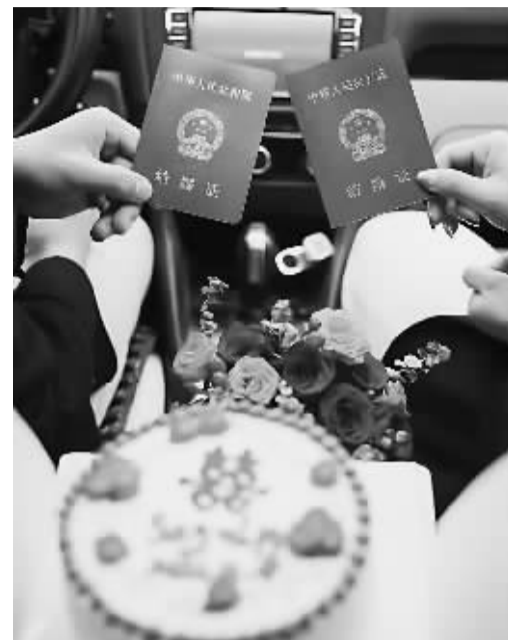
■也许正因为彼此的不完美,才让我们成为彼此的完美伴侣。资料图片

放下标准,放平心态,就当去认识一个陌生人,去了解一个新朋友,你会发现其实脱单也不是什么难事!作为服务石家庄优质单身的公益相亲平台,我们不仅帮助众多优质单身牵线搭桥,还会通过心理辅导帮助单身朋友更清晰地认知自己,合理改善择偶需求,更精准地为大家服务。来燕赵晚报找三观相似、学历高素质高的单身朋友,更容易“因爱好相遇,因学识相识”。你选择,我牵线,喜欢就把TA选出来,让我们一起告别单身!想认识本期推荐的优秀单身,请添加晚报红娘微信 15032136173 或扫二维码咨询。