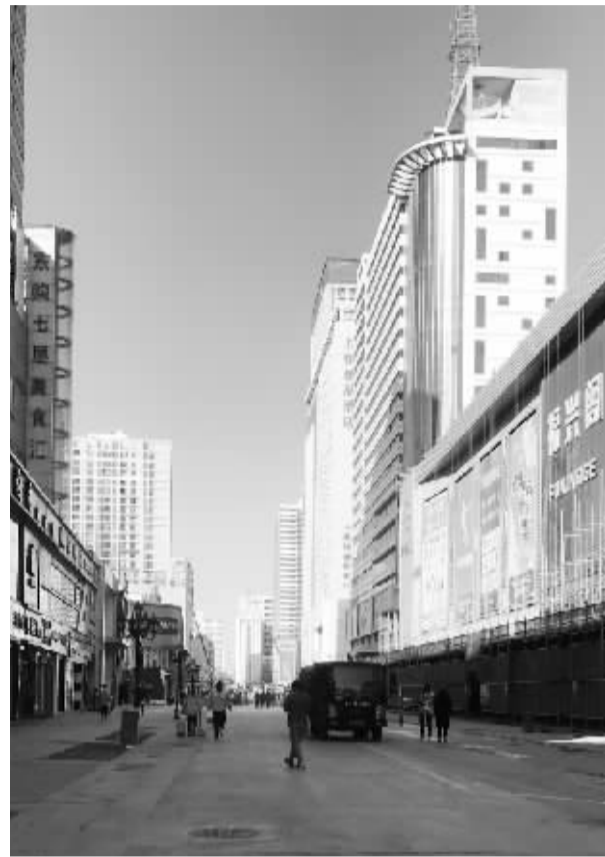
■民族路湾里步行街升级改造施工现场。