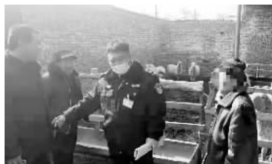
■民警叮嘱老卢一定要注意锁好圈门。

27 只羊要真丢了,就得损失数万元。接警的灵寿县公安局南寨派出所民辅警迅速赶到羊圈进行初步侦查。链锁确实没有丝毫破坏,羊圈里没有羊受惊时的杂乱奔跑痕迹,羊圈四周也并不稍大型的货车印迹。基本确定是羊群自行脱离羊圈后,几位民辅警分兵两路,一路试着调取该村附近的路边监控,一路就地在该村及周边村走访调查。他们在询问了多位村民后,终于得到了一位热心村民提供的有效线索:不少羊曾向着村西方向而去。于是,民警改变了寻找方向,一路向西追寻。在看到邻村正在放羊的老大爷后,民警向其打听羊群下落,这名老大爷指着刚刚拦下的五六只羊称,其看到了这几只落在羊群后面的羊,