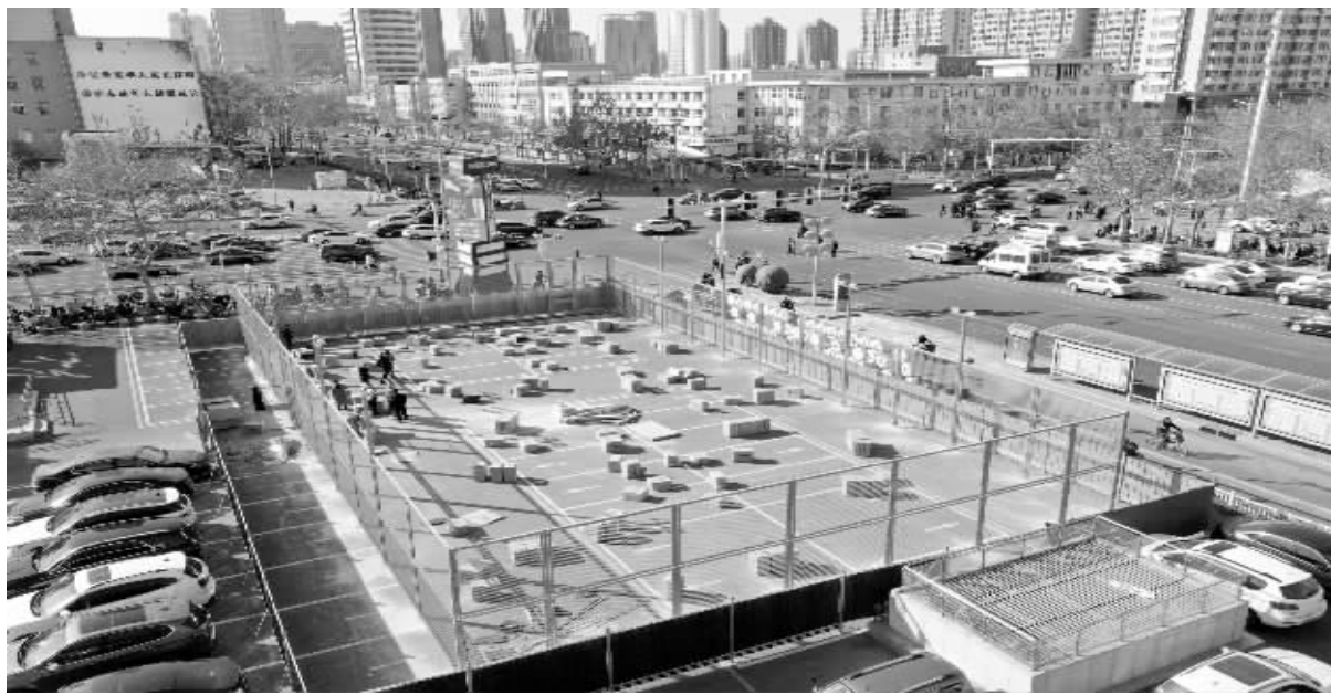
■裕彤国际体育中心西广场上正在建设的篮球场。

昨日下午,石家庄市体育局的工作人员介绍,在今年要建成的 200 多个球类运动场地当中,目前,结合场地位置等实际情况,已全面开建的是第一批共 81 个场地。“之后,还会有更多的场地陆续建成开放,惠及更多市民。”