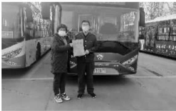
■吴女士顺利找回遗失的档案袋。