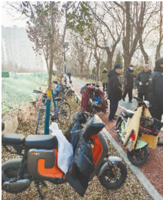
■弹弓爱好者随意停放的车辆碾轧着步道旁的绿化带。