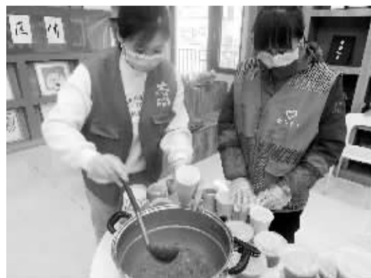
■西三庄街道所辖社区志愿者熬制腊八粥。

本案中,出租人负有在租赁期间保持租赁物符合约定用途的法定义务,现出租房屋甲醛含量超标,应认定为经纪公司构成违约,其应承担相应的违约责任。对于宋先生居住期间的租金及服务费用如何返