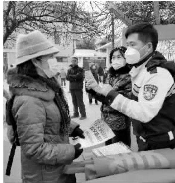
■工作人员进社区开展交通安全宣传。

本报讯(首席记者 杜慧)1月10日上午,石市新华区西苑街道西苑社区联合石家庄市公安局交通管理局新华交警大队,在西苑小区北院开展了电动车安全使用宣传活动,通过发放明白纸、倡议书的方式,向居民普及电动车管理相关政策,让更多的群众了解文明出行的重要性,倡导居民自觉遵守交通规则,远离交通事故,做到文明出行、安全出行。