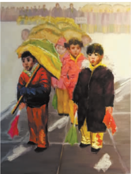
■《井陉拉花闹正月》李纪伟