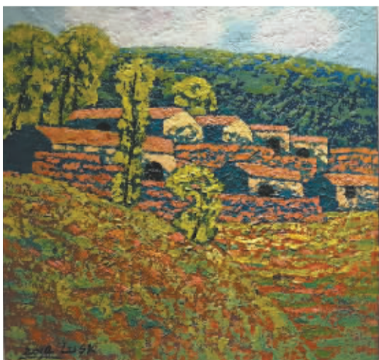
■《太行系列石板岩》鲁树凯