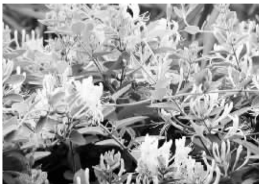
■巨鹿金银花。(资料图)

通过开展“中国气候好产品”气候品质评价,有助于厘清金银花受气象条件影响的程度,为巨鹿县气象局积极开展金银花全生育期气象服务、指导金银花种植户科学管理提供技术支撑,以精细化气象服务保障金银花稳收增收,确保巨鹿金银花持续优质高产,进