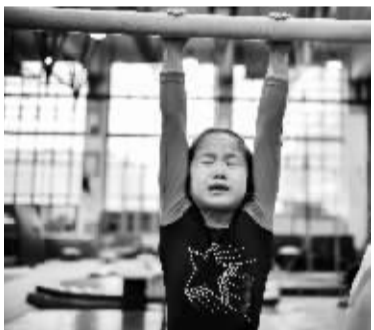
■4月17日,石家庄少体校体操队训练中的坚韧女孩。