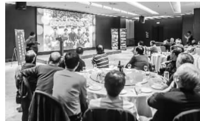
■10月9日晚,河北足球队50年庆典活动举行,当初的绿茵少年如今已是白头,但对河北足球的热情始终未变。

学校将以技能大赛为载体,进一步提高学生的技能水平和专业度,更好的融合岗课赛证的培养模式,相信石家庄城市建设学校在建筑类领域会有更大的进步,在今后的各项职业技能竞赛中再创佳绩。