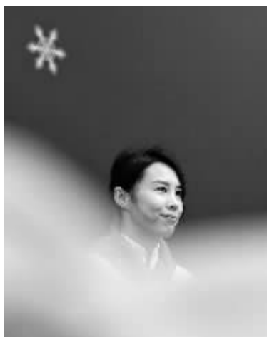
■10月13日,河北省校园冰雪季开幕式在桥西外国语小学举行,奥运冠军、河北省冰雪运动推广形象大使王涵出席。