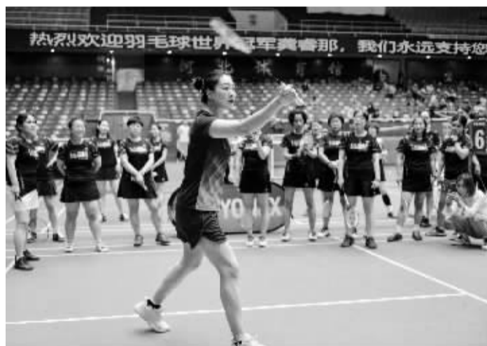
■6月26日,羽毛球世界冠军龚睿那来石,“粉丝”们学艺不忘追星。