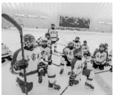
■10月16日,河北省第三届冰雪运动会冰球比赛,球员在听教练的战术布置。