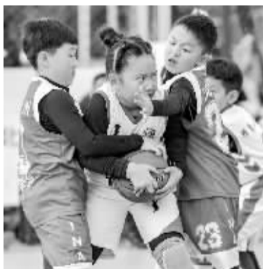
■10月22日,中国小篮球联赛河北赛区开赛,图为小球员在比赛中。