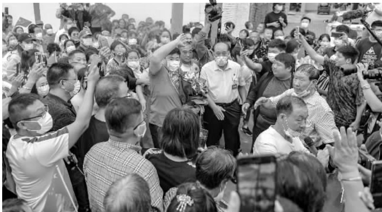
■9月23日,巩立姣回到阔别一年的鹿泉邵营村,向父母和乡亲们挥手致意。