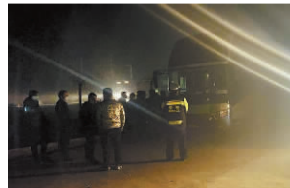
■浓雾中的大巴车乘客超员9人被查。

本报讯(记者 李兵)12月11日凌晨,元氏县境内被大雾笼罩,为减少交通事故发生,元氏县交警大队启用恶劣天气应急预案,加强辖区巡逻力度,确保辖区车辆安全通行。